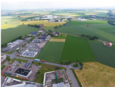
Gewerbefläche Heidweg ca. 13.000 qm.jpg