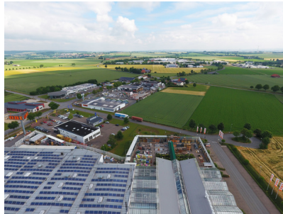
Industriestraße von der B7.jpg