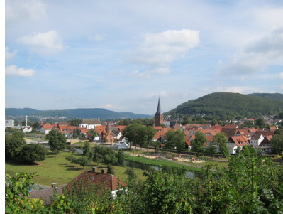
Blick auf die Altstadt von Lügde.jpg