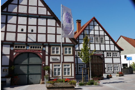
Altstadt mit Heimatmuseum.jpg