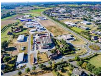
Blick auf das Gewerbegebiet Olfen-Ost. Im Hintergrund:

Dass dies bei den Verantwortlichen in den Unternehmen geschätzt wird, zeigt das stetige Wachstum der Olfener Gewerbegebiete in den vergangenen Jahren. Auch die Zahl der sozialversicherungspflichtigen Arbeitsplätze konnte seit 1999 um 37,5 % gesteigert werden.