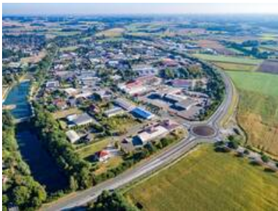
Blick auf das Gewerbegebiet Olfen-Hafen