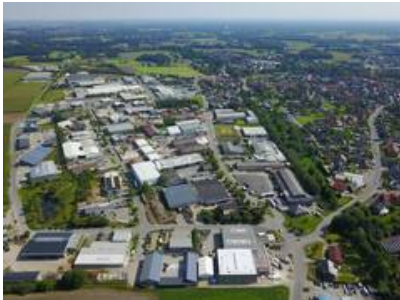
Industriegebiet 170828 (18).JPG