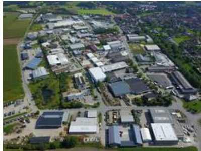
Industriegebiet 170828 (17).JPG