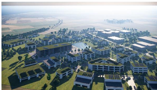
BPJ-Flug in die Zukunft