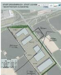
Elsbachtal: Potenzielle Flächen als Platzhalter