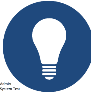
Admin System Test Admin_System_Test.png