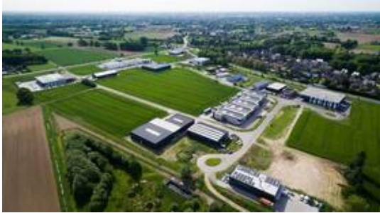
Luftbildansicht Gewerbegebiet Holtwick