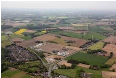
Luftbildansicht Gewerbegebiet Holtwick