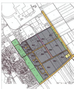
IPAS - Bebauungsplan Nr. 10 (1. Änderung)