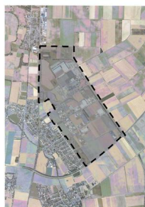
IPAS (Industrie- und Gewerbepark "Am Silberberg")