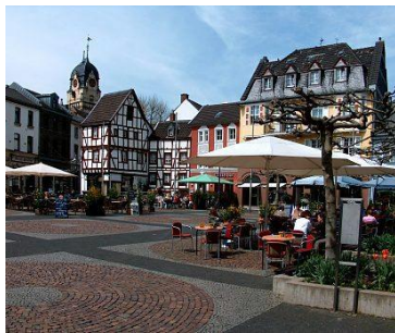
Alter Markt, Euskirchen

Die Kreisstadt Euskirchen liegt landschaftlich reizvoll im Städtedreieck Aachen (70 km) - Bonn (30 km) - Köln (40 km). Dies ist ein Grund, warum sich Euskirchen, mit über 58.000 Einwohnern, zu einem attraktiven und dynamischen Mittelzentrum mit oberzentralen Funktionen entwickelt hat. Garant für die positive Entwicklung sind leistungsstarke Handwerks-, Handels-, Gewerbe- und Industriebetriebe, die sich in Euskirchen als größter Stadt des gleichnamigen Kreises niedergelassen haben.