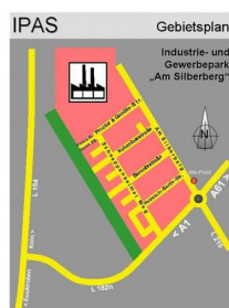
IPAS - Übersicht mit Straßennamen