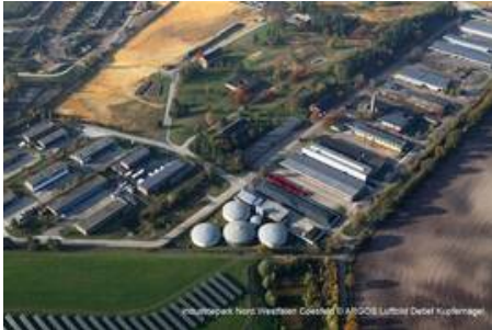
Krampe Fahrzeugbau im Industriepark Nord.Westfalen