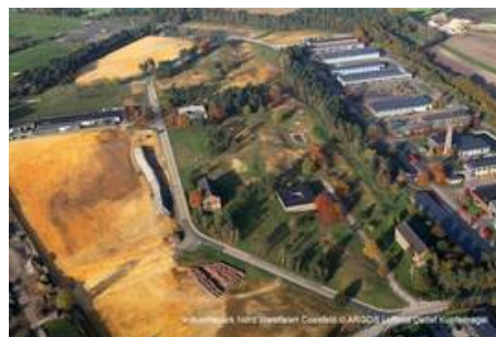
6.3 ha Industriefläche im Industriepark Nord.Westfalen