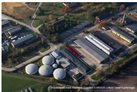
Biogasanlage im Industriepark Nord.Westfalen