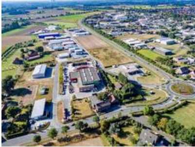
Blick auf das Gewerbegebiet Olfen-Ost. Im Hintergrund: