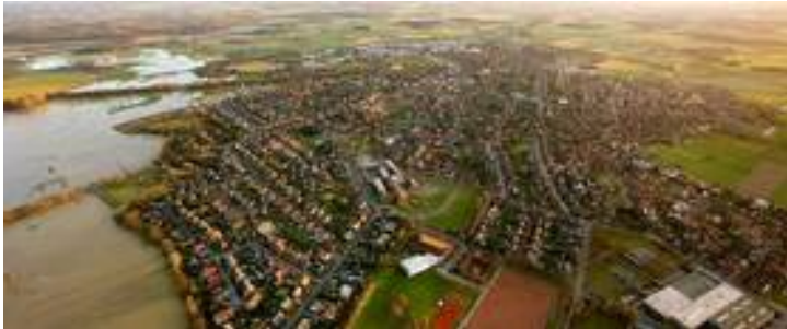
Blick auf die Stadt Olfen. Am linken Bildrand: Die Steveraue