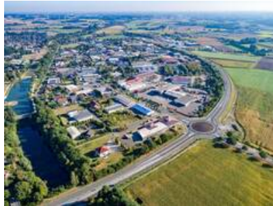
Blick auf das Gewerbegebiet Olfen-Hafen