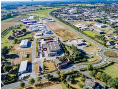
Blick auf das Gewerbegebiet Olfen-Ost. Im Hintergrund: