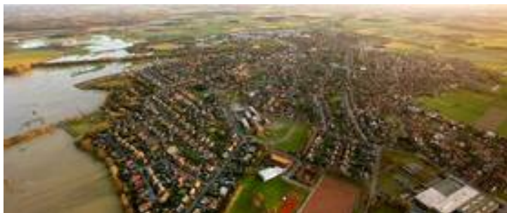
Blick auf die Stadt Olfen. Am linken Bildrand: Die Steveraue

Dass dies bei den Verantwortlichen in den Unternehmen geschätzt wird, zeigt das stetige Wachstum der Olfener Gewerbegebiete in den vergangenen Jahren. Auch die Zahl der sozialversicherungspflichtigen Arbeitsplätze konnte seit 1999 um 37,5 % gesteigert werden.