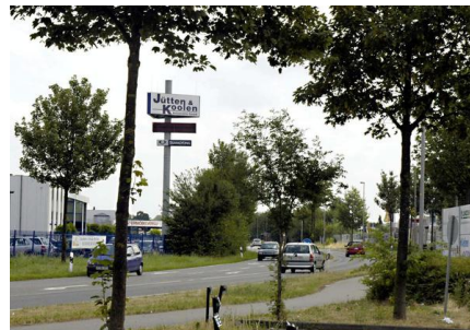
Gewerbe- und Industriegebiet Dremmen