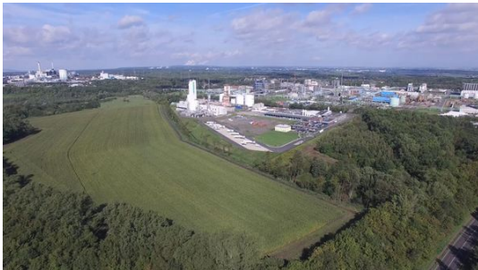
Süderweiterung Chemiepark Knapsack.JPG