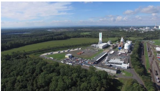
Süderweiterung 2 Chemiepark Knapsack.JPG