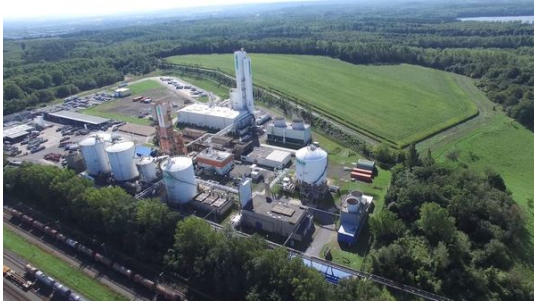
Süderweiterung 3 Chemiepark Knapsack.JPG