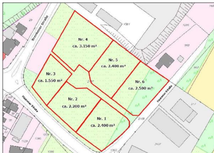
Lageplan Ruhnenpöstchen II.jpg